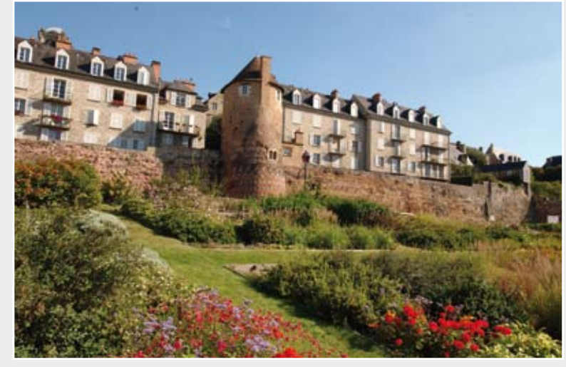
La muraille romaine et les jardins de Gourdain