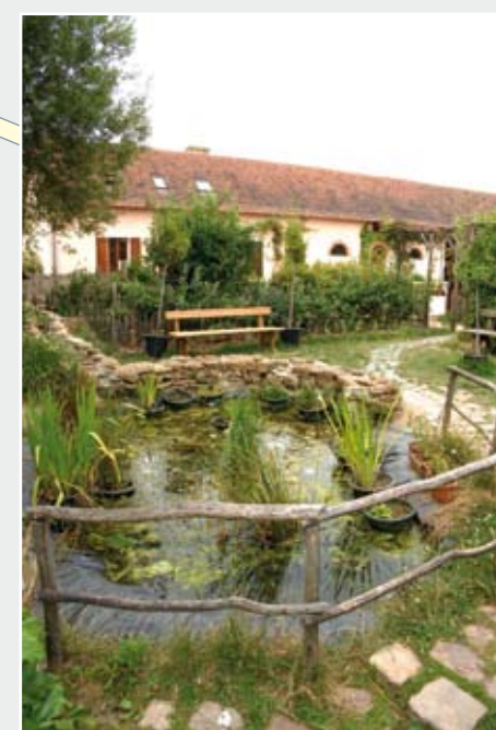
Le jardin de la Ferme de la Prairie à l'Arche de la Nature