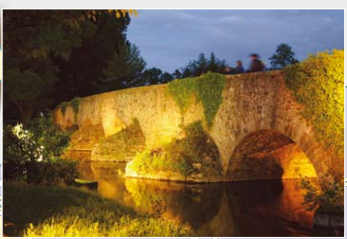
Le pont romain à Yvré-l'Évêque