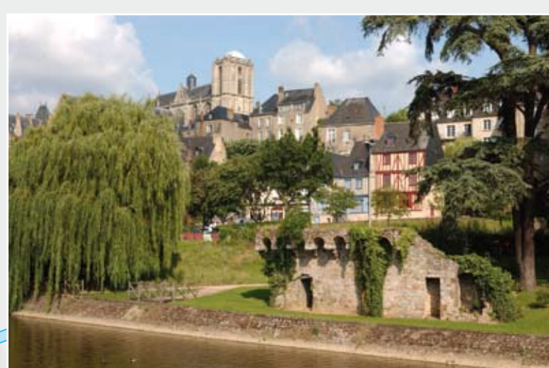
La cathédrale Saint-Julien vue depuis le jardin des Tanneries