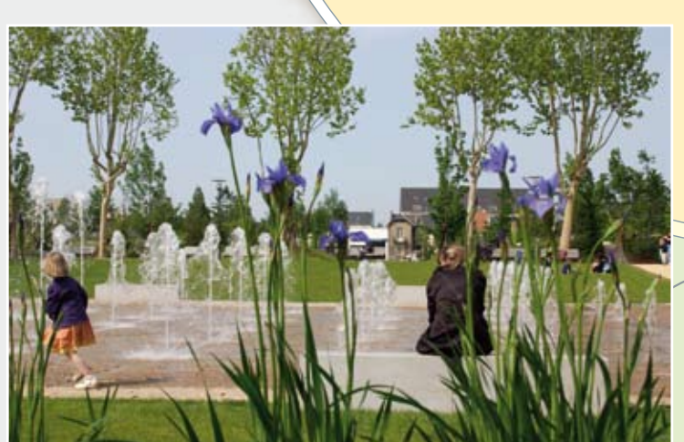
Le parc Théodore-Monod