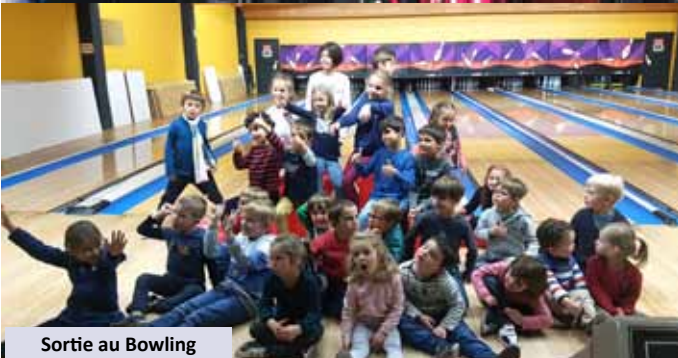
Sortie au Bowling