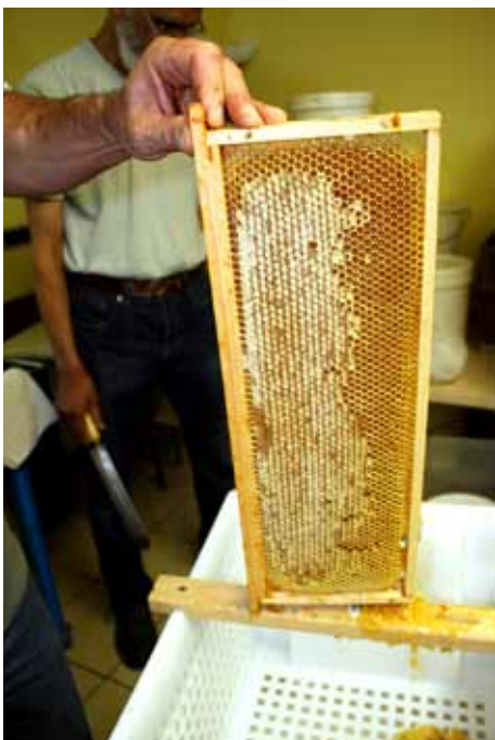
Collecte de miel

L'association intervient à l'Arche de la Nature, au Lycée Agricole de Rouillon ainsi qu'à la foire des 4 jours du Mans.