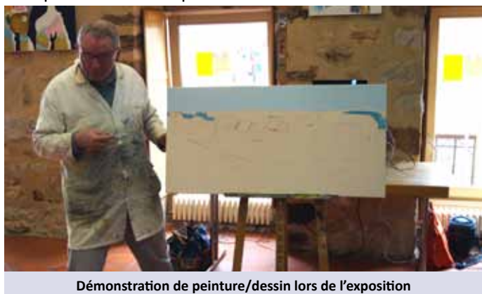
Démonstration de peinture/dessin lors de l'exposition

L'animateur Dessin/Peinture propose à partir de la rentrée des stages à la journée de peinture ainsi que des initiations à l'aquarelle une fois par mois.