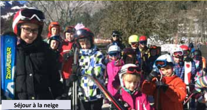
Séjour à la neige