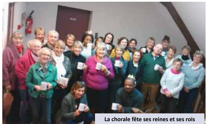
La chorale fête ses reines et ses rois

Les cours reprendront le dimanche 15 septembre prochain à 15 heures à la Ferme Saint Christophe.