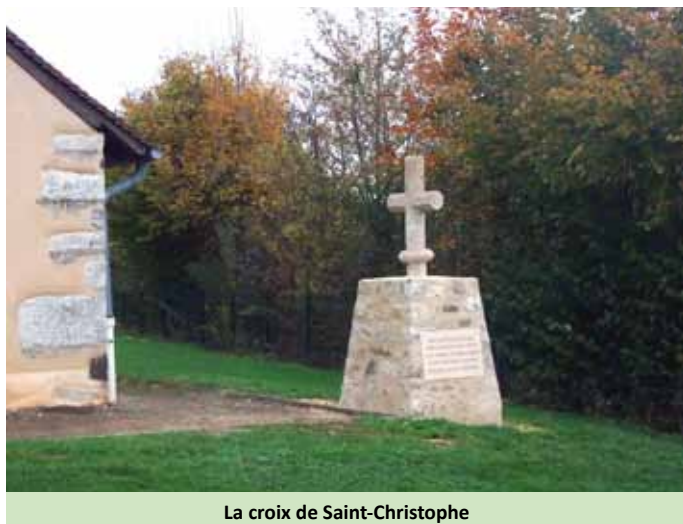
La croix de Saint-Christophe