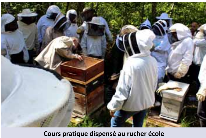
Cours pratique dispensé au rucher école

Cette formation n'est pas diplômante. Elle se compose de cours pratiques et de cours théoriques sur le site du rucher école.