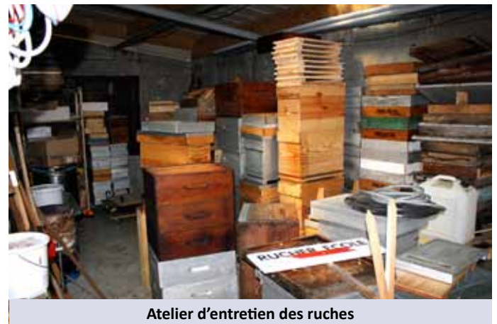
Atelier d'entretien des ruches

L'Union Syndicale travaille également sur la lutte contre le Frelon Asiatique conjointement avec les mairies, le Conseil Départemental et l'INRA.