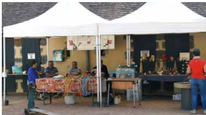
Marché des producteurs et créateurs lors de l'exposition

A cette occasion, le samedi était organisé un marché de producteurs et de créateurs locaux. Vous pouviez y retrouver des producteurs de Jasnières, de confitures, de miel, de bière ... ainsi que des créateurs de bijoux ou d'objets en bois. La partie restauration était confiée au Foodtruck Unik'Mans qui proposait gaufres, crêpes et glaces pour le goûter ainsi que des plats à base de gaufre de pomme de terre. Une petite centaine de personnes se sont ainsi retrouvées pour dîner dans une atmosphère années 60 très conviviale. Certains ont même profité de cette soirée pour esquisser quelques pas de danse.