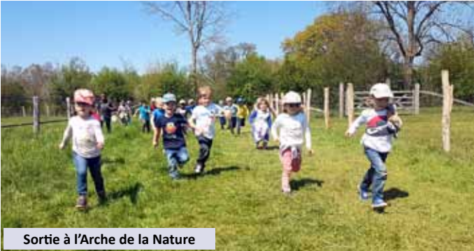
Sortie à l'Arche de la Nature