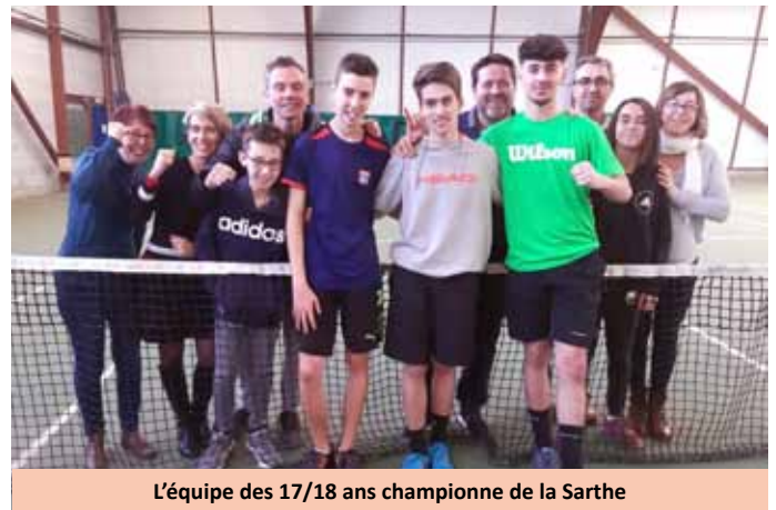
L'équipe des 17/18 ans championne de la Sarthe

Chez les jeunes, nos équipes en Régionale se sont bien défendues, mais c'est en Championnat Départemental que notre équipe des 17/18 ans a remporté brillamment le titre de Champion de la Sarthe.