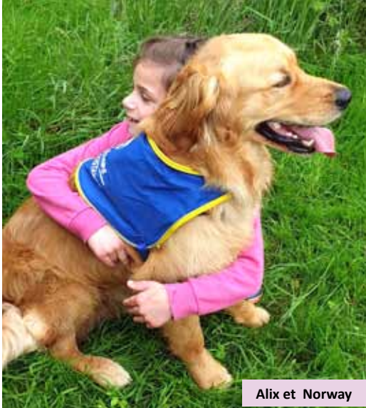
Alix et Norway

Mais quelle fierté à l'issue des 16 mois et des 6 mois en centre de formation, de le voir réussir son examen de passage et devenir officiellement " Chien d'Assistance ".