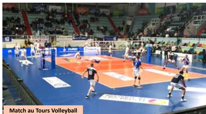
Match au Tours Volleyball

✓ Des stages pour tous les jeunes ont été organisés sur les vacances d'Hiver et de Printemps. Sur une des journées nous avons eu le plaisir de faire découvrir à des jeunes de l'IME Léonce Malécot la pratique du volley santé ;