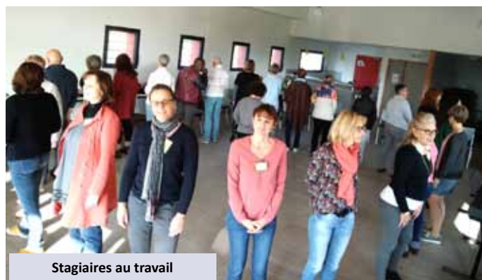
Stagiaires au travail