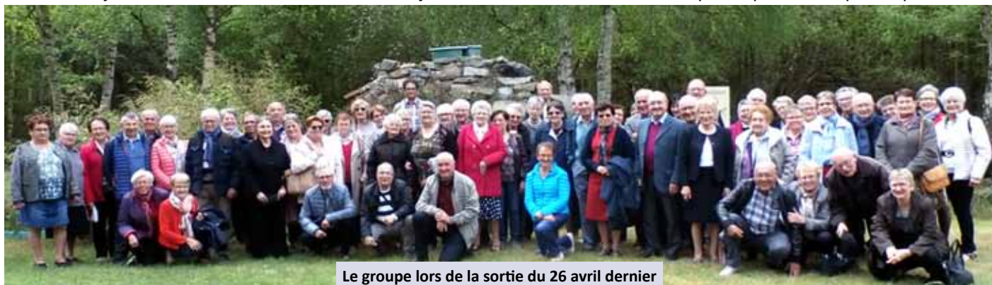
Le groupe lors de la sortie du 26 avril dernier

La dernière journée Interclubs s'est déroulée le 6 juin dernier avec un concours de pétanque au complexe sportif.