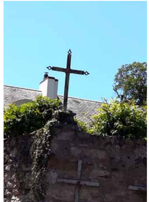
La croix Véron, ancienne croix Lamoureux

Cette haute croix dissymétrique taillée dans du grès roussard, située à l'extrémité de l'agglomération, ne figure pas sur le territoire de la commune mais sur celui de La Milesse. Elle ressemble fort à une autre, celle des Riderays, route de Degré, la seule des croix de La Chapelle qui ne soit pas sur l'axe Le Mans-Sillé. Toutes deux devaient constituer des repères qui jalonnaient les vieux itinéraires vers le Mont Saint-Michel, dès les temps médiévaux.