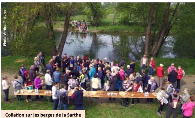
Collation sur les berges de la Sarthe

Près d'une centaine de personnes étaient présentes dès 9h00 au Centre Saint Christophe afin de découvrir la première des deux balades proposées conjointement par la municipalité et l'ARC Randonnée. Après avoir emprunté plusieurs tronçons du Boulevard Nature et sentiers de la commune, les randonneurs ont longé les bords de Sarthe en direction de la liaison "Le Capalvi", le bateau à chaînes inauguré en novembre dernier et reliant La Chapelle Saint Aubin à Saint Pavace. C'est sur les berges de Saint Pavace qu'étaient attendus les marcheurs pour une collation offerte par la Municipalité.