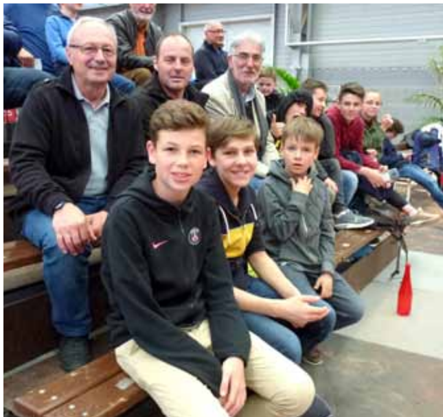
Sortie au Tournoi Open d'Angers

Pendant les vacances d'Hiver et de Printemps nous avons organisé plusieurs animations pour nos jeunes du club (TMC, Journées jeux et Matches).