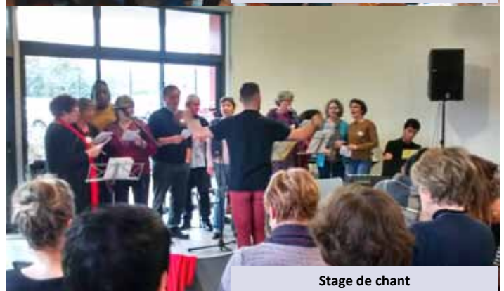
Stage de chant