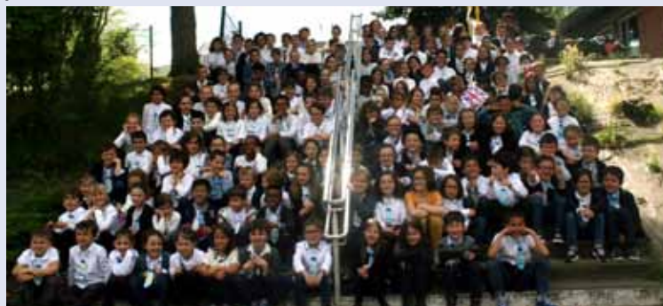
Les élèves du primaire avant le "flash mob"