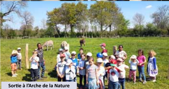
Sortie à l'Arche de la Nature