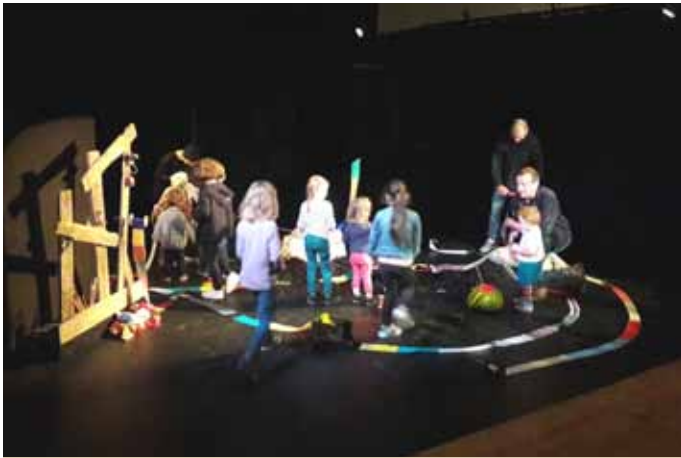
Après le spectacle "Un mouton dans mon pull" les enfants sont montés sur scène

En effet, nous nous sommes retrouvés dès janvier avec "Les Kioubes", un spectacle déjanté que les familles ont eu plaisir à découvrir !