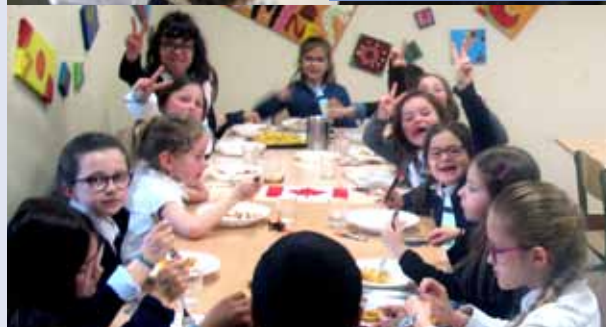
Au menu, Salade Coleslaw, Fish & Chips et Crumble aux cerises