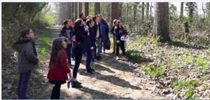
Parcours d'orientation et d'observation jusqu'au Burger King

Le reste des vacances, les enfants sont allés à Tépacap, ont fait de la thèque (sport dérivé du baseball), un tournoi de poker, un parcours d'orientation et d'observation jusqu'à Burger King et un atelier cuisine autour du chocolat.