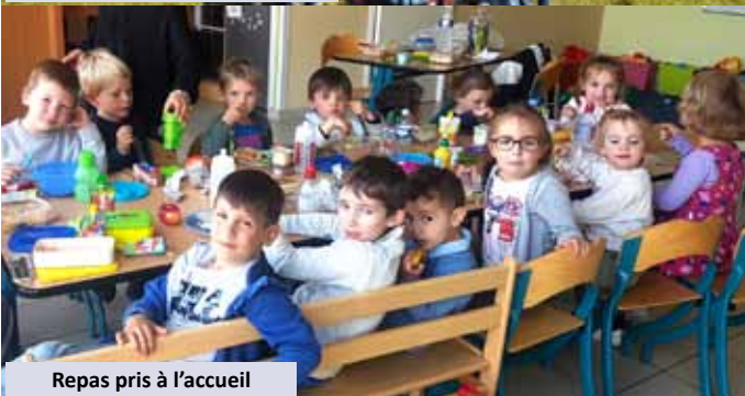
Repas pris à l'accueil

Depuis quelques temps l'effectif de l'Accueil augmente, autant les mercredis que pour l'accueil périscolaire. Les bambins sont toujours présents, avec un sourire ou pas.