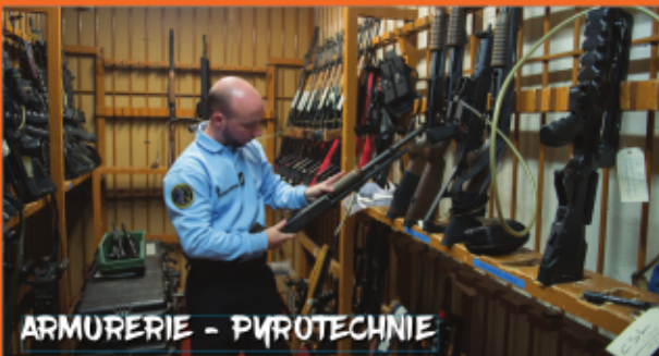
ARMURERIE - PYROTECHNIE