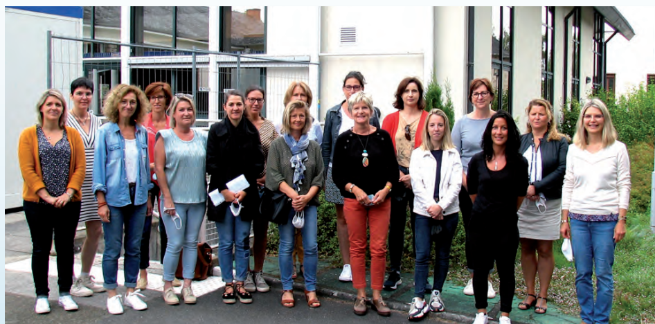
L'équipe éducative composée de 11 enseignantes, de 3 ATSEM (Agents Territoriaux Spécialisés des Écoles Maternelles) et de 3 AESH (Aide aux Éléves en Situation de Handicap).